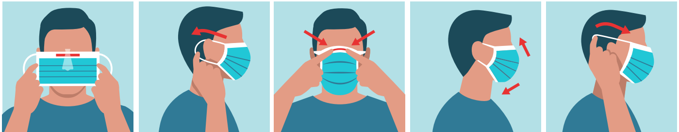
Step 1 | Schritt 1